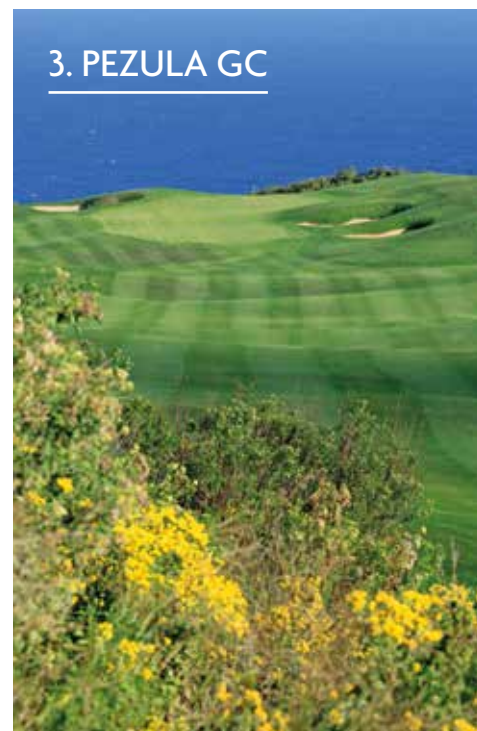
3. PEZULA GC