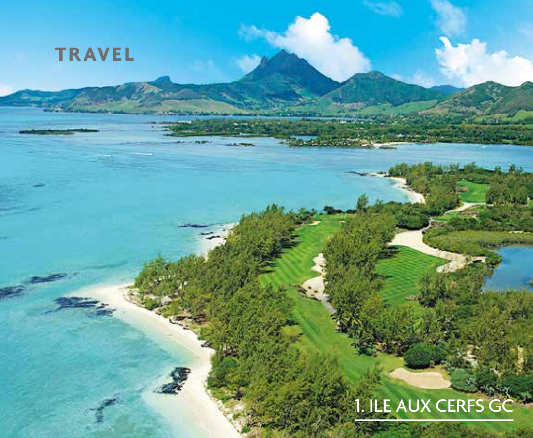
1. ILE AUX CERFS GC