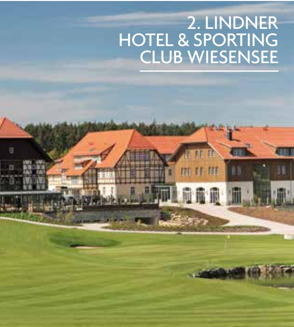
2. LINDNER HOTEL & SPORTING CLUB WIESENSEE