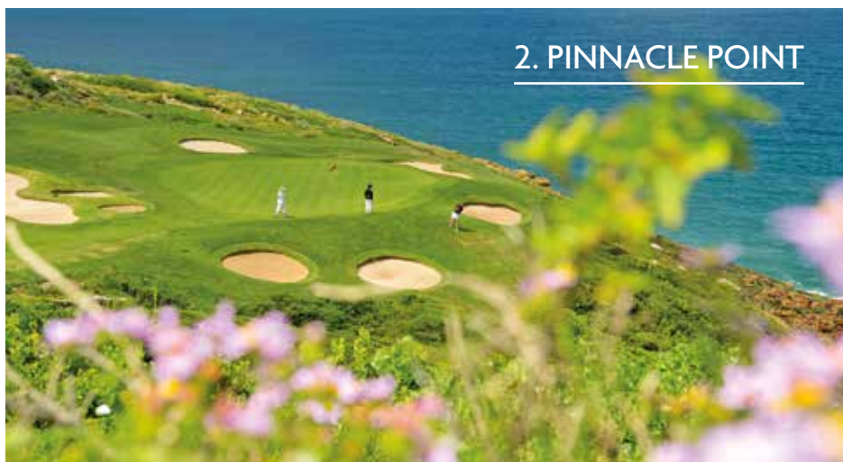
2. PINNACLE POINT

In der Wertung »Beliebtestes Resort & Hotel International« gibt es ebenfalls keine Veränderung zu vermelden. Als Lieblingsadresse außerhalb Deutschlands begrüßt weiterhin das Dolomitengolf Hotel & Spa in Osttirol, an dem z.B. Lothar Wie-